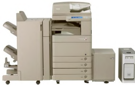
Canon imageRUNNER Serie

HD bietet Druck- und Kopiersysteme der Hersteller Canon und Konica Minolta an. Beide Unternehmen bieten ein umfangreiches Portfolio an hochwertigen Ausgabesystemen, die sich an den Ansprüchen moderner Büros orientieren.