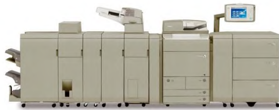
Canon imageRUNNER PRO Serie