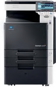
Konica Minolta bizhub Serie