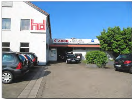
Unternehmensgebäude in Dillingen

HD: Büro- und Kopiergeräte GmbH wurde 1983 in Saarbrücken als Fachhandel für Bürotechnik gegründet. Nach 14 erfolgreichen Jahren in der Landeshauptstadt erfolgte 1997 der Umzug an den neuen Standort in Dillingen an der Saar, von wo aus wir heute Unternehmen unterschiedlichster Branchen im Saarland, Luxemburg und auch Teilen von Rheinland-Pfalz betreuen.