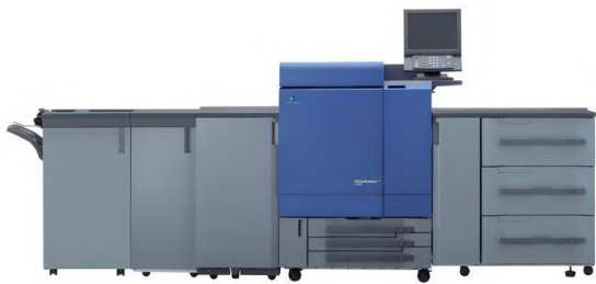
Konica Minolta bizhub PRESS Systeme

Der Bereich Produktionsdruck benötigt Systeme mit besonderen Merkmalen. Verschiedene Papiermedien wollen verarbeitet werden, Abgabetermine müssen eingehalten werden, Farb- und Standfestigkeit sind gefordert. Gemeinsam mit unseren Partnern bieten wir Systeme an, die speziell für den Produktionsbereich entwickelt wurden.